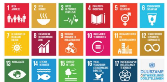
SDG's volgens de Verenigde Naties

Als we kijken naar de Arnhemse doelen voor de circulaire economie zien we dat er een directe link te maken is naar veel SDG's. Waar deze directe link zit laten we zien in onderstaande tabel.